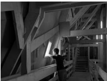
Das letzte Land , 2005, Padiglione Austriaco, Venezia