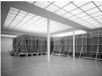
Astronaut (komme gleich) , 2003, Secession, Vienna, Foto: Matthias Herrmann