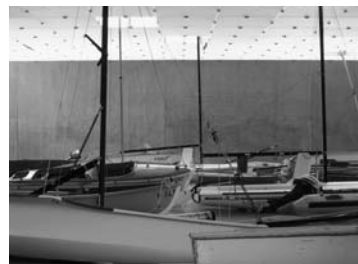
Das Rendezvousproblem, 2004: You have cum in your hair and your dick is hanging out; Cosmos and Demos; Song of Most, Song of All; Kunsthau Bregenz, Foto: Markus Tretter