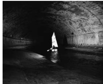
Wienfluß, Wien, 16. Februar 2002, 2002