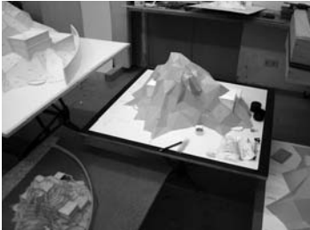
Das letzte Land , 2005, Foto: Hans Schabus